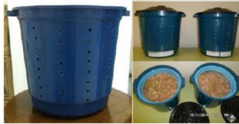
Gambar 4. Komposter sederhana