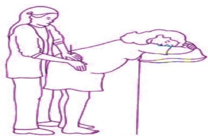
Gambar2. Tehnik massage counter pressure menggunakan jem ball