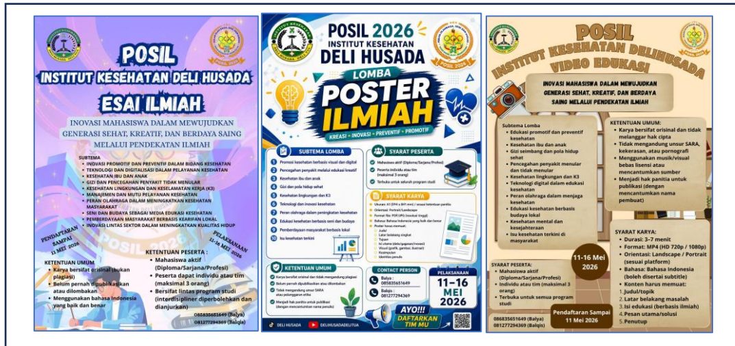
Gambar 1. Flyer Promosi Lomba Poster Ilmiah, Essay Ilmiah, Video Edukasi