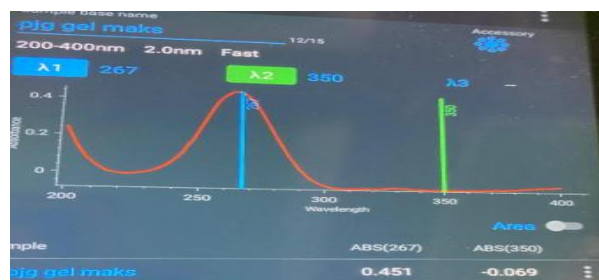
Gambar 4.1 Spektrum Panjang Gelombang Maksimum